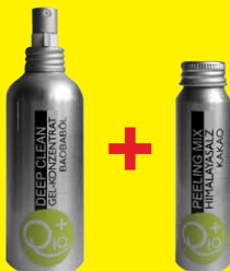
Deep Clean + Peeling Mix