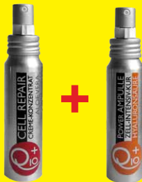
Cell Repair + Power Ampoule