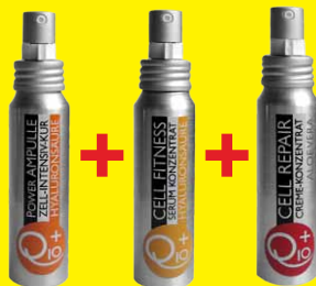
Power Ampoule + Cell Fitness + Cell Repair