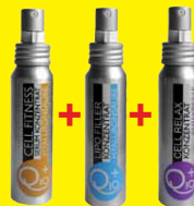
Cell Fitness + Lipo Filler + Cell Relax