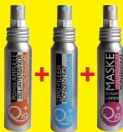
Power Ampoule + Lipo Filler + Eye+Lip Mask