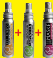
Cell Fitness + Stem Cell + Eye+Lip Mask